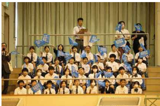
玄海みらい学園観戦