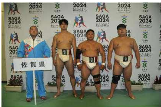
成年男子佐賀県選手団