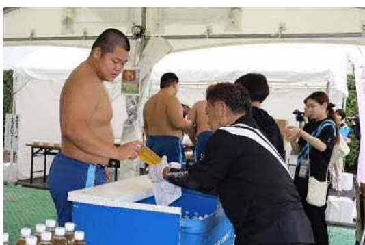
無料ドリンク配布