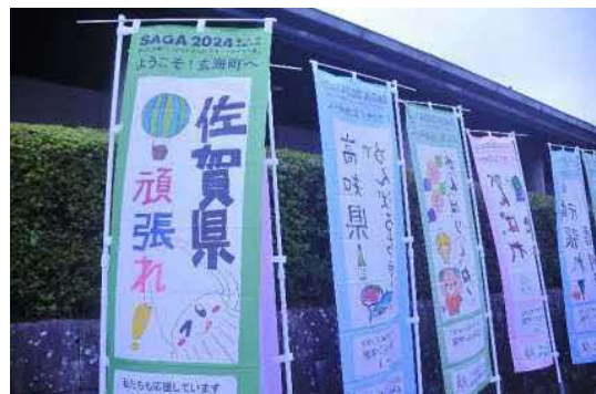
応援のぼり旗 (玄海みらい学園)