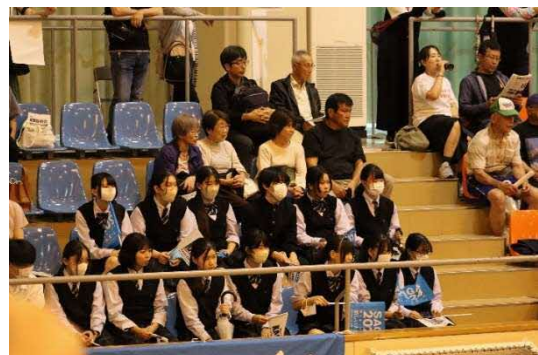
唐津青翔高等学校観戦