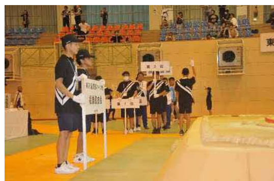
プラカード、選手誘導 (唐津青翔高等学校)