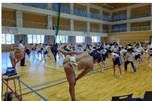
相撲健康体操 (玄海みらい学園)