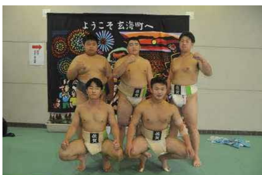
少年男子佐賀県選手団