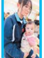
抱っこしてもらったよ！