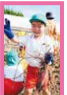
イエーイ！ 大きいよ☆ 抜けた！