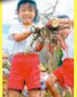
いっぱいとれたよ