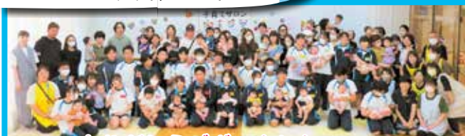
ありがとうございました！