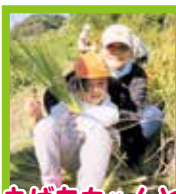
おばあちゃんと 一緒に☆