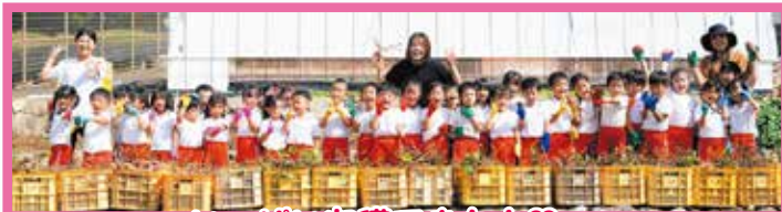
いっぱい収穫できたよ♡