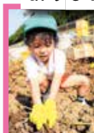
うんとこしょ！どっこいしょ！