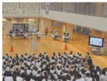
身近な原子力について学習