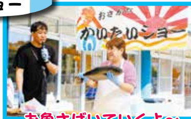
お魚さばいていくよ～