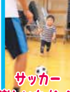
サッカー 楽しいな(人-人)