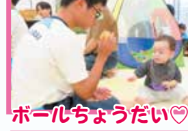
ボールちょうだい♡