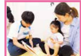
絵本読んでもらったよ