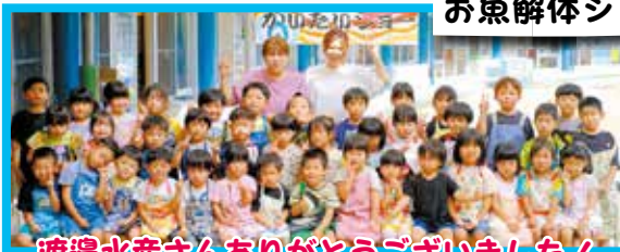
渡邊水産さんありがとうございました！