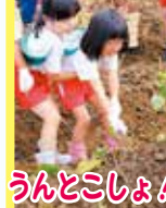
うんとこしょ！ どっこいしょ！ おおきいでしょ！