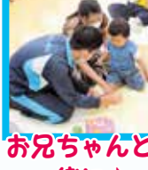
お兄ちゃんと 一緒に♪