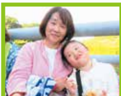
おやつ美味しいね！