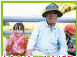
おじいちゃんおばあちゃんありがとう♡