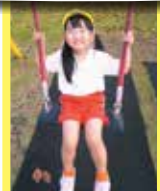
あすぴあであそんだよ～