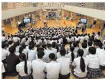
みらいホールに集合

体内被ばくを防ぐための安定ヨウ素剤の服用の仕方を学び、児童・生徒、保護者ともに引き渡し訓練を行いました。児童・生徒は先生方の指示のもと、真剣な面持ちで訓練に取り組みました。