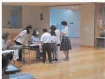
真剣に取り組む様子