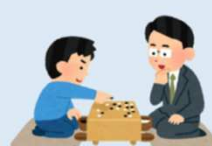
囲碁・将棋クラブ