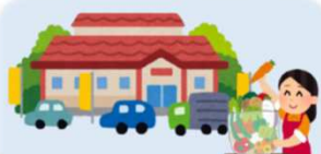
道の駅（物販・飲食）