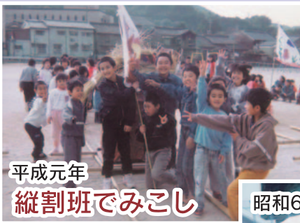
平成元年 縦割班でみこし