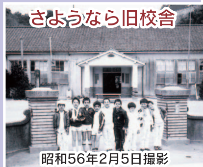
さようなら旧校舎