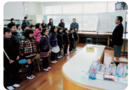
お礼に牟形小校歌を歌いました