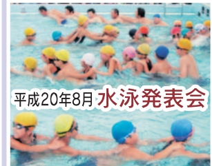
平成20年8月 水泳発表会