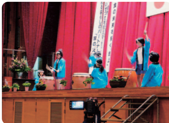
元気に演奏する子どもたち