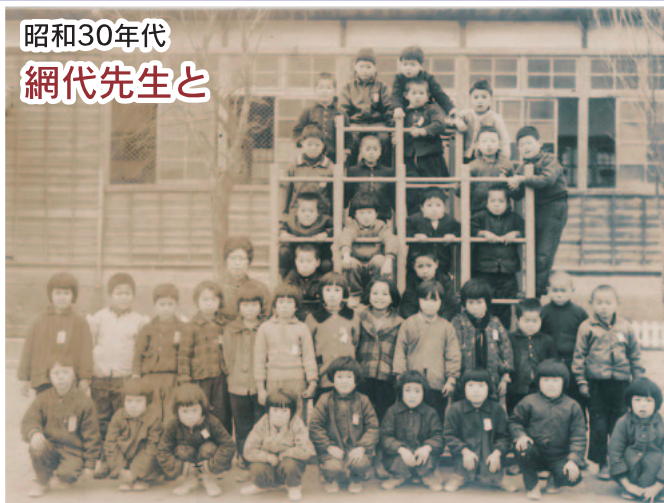
昭和30年代 網代先生と