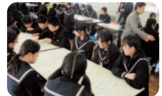
縦割りグループ対抗戦にや る気満々

本校新年恒例行事の百人一首大会。ぴんと張り詰めた空気の中、読み手の先生の声に素早く反応する子どもたち。札を取るたびに歓声が起き、熱戦を繰り広げました。今年は子どもたちの目の色が違いました。新しい札を購入し、やり方も学年ごとの大会から、全校生徒9つの縦割りグループ対抗に変えたからです。全校生徒がランチルームに集まったの大会は圧巻でした。(文責：教頭)