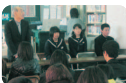
校長先生と生徒会本部役員から