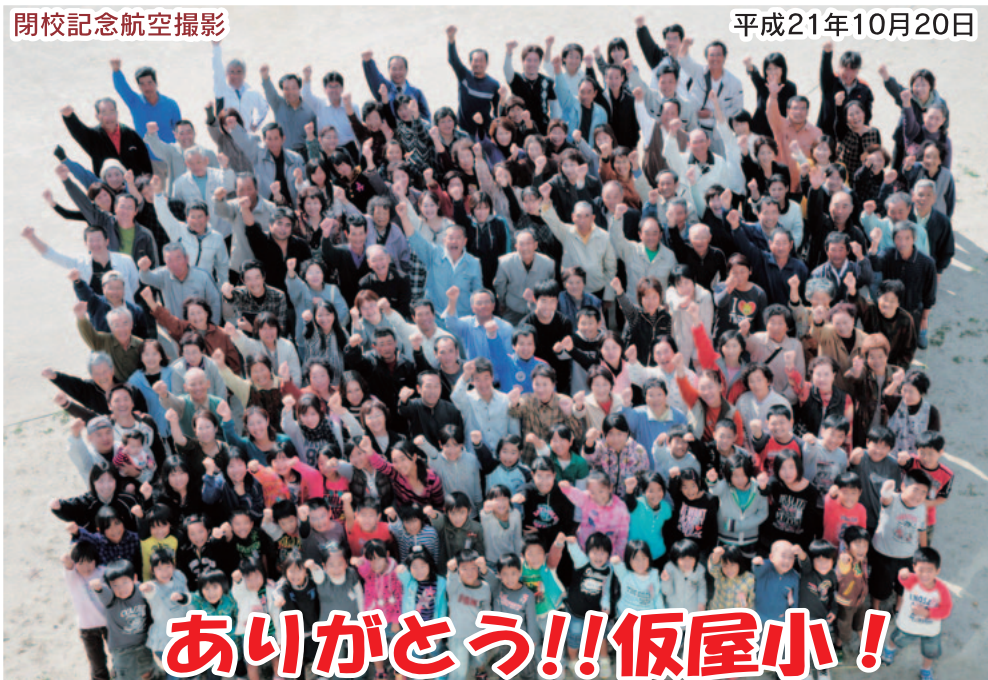
閉校記念航空撮影