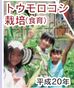
トウモロコシ栽培(食育)