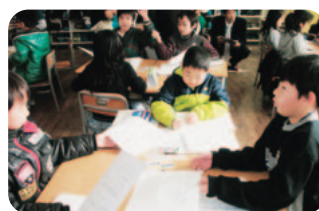
友だちと交流、3年生