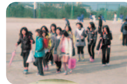
あっちに行ったり…