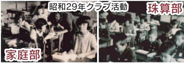
昭和29年クラブ活動