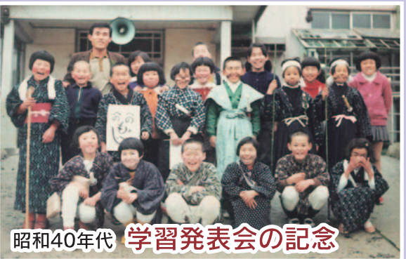
昭和40年代 学習発表会の記念