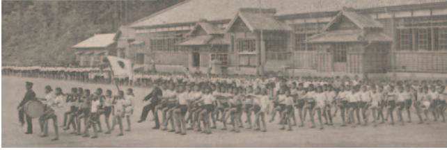
昭和16年 国民学校生徒日の丸行進