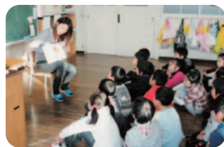
本の世界へ読み聞かせ