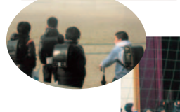
こっちに行ったり…