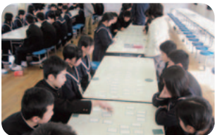
上の句を聞くとすぐに 「はい」

本校新年恒例行事の百人一首大会。ぴんと張り詰めた空気の中、読み手の先生の声に素早く反応する子どもたち。札を取るたびに歓声が起き、熱戦を繰り広げました。今年は子どもたちの目の色が違いました。新しい札を購入し、やり方も学年ごとの大会から、全校生徒9つの縦割りグループ対抗に変えたからです。全校生徒がランチルームに集まったの大会は圧巻でした。(文責：教頭)