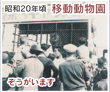
昭和20年頃 移動動物園