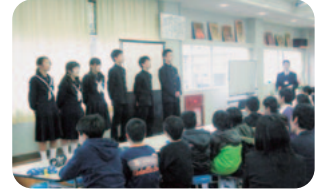
生徒会役員による プレゼンテーション