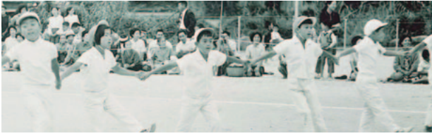
学習発表会にて 2年生