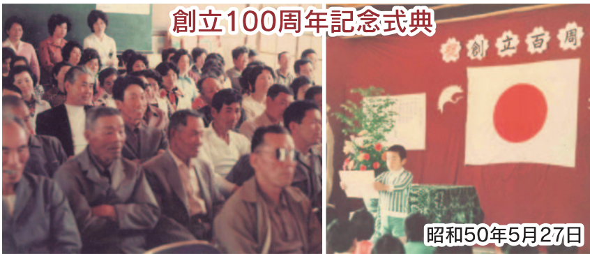
創立100周年記念式典