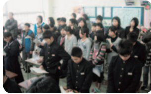
先輩が元気に歌う音楽の 授業を参観