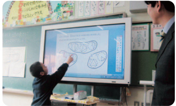
3年 算数科「三角形の性質」