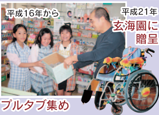
平成16年から 平成21年 玄海園に 贈呈