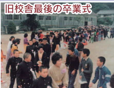
旧校舎最後の卒業式