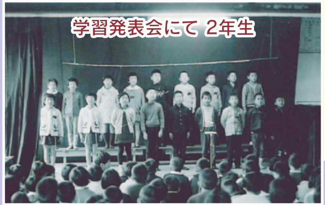
学習発表会にて 2年生