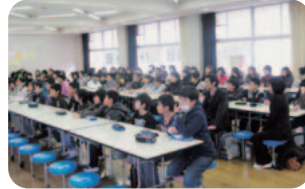
話をしっかり聞く6年生