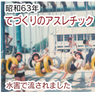
昭和63年 てづくりのアスレチック