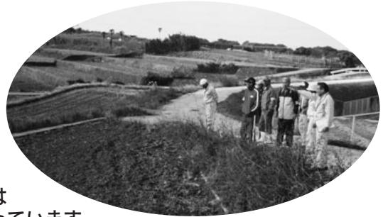
農業委員会は 農地パトロールを行っています