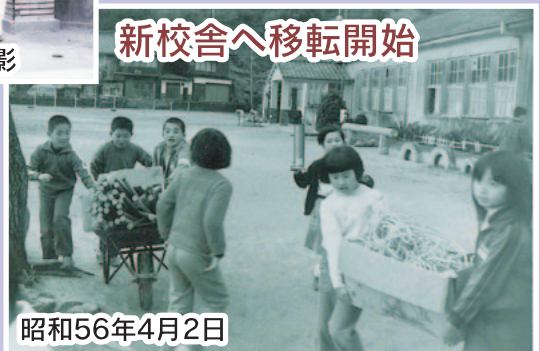
新校舎へ移転開始