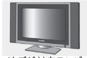
地デジ対応テレビ