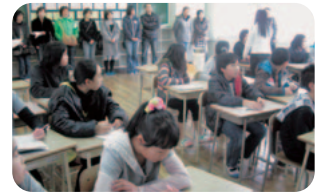
英語の授業を体験 少し緊張しました

1月22日(金)の午後、有浦小・仮屋小・牟形小の6年生を迎えて、「1日体験入学・学校説明会」を行いました。先輩の授業を参観した後、はじめての中学校での授業体験。英語の授業では、先生の「nice to meet you」に対してはにかみながら答えました。理科の授業では、浮力を利用した不思議な実験に熱中。後半は、6名の生徒会役員が毎日遅くまで残って作ったプレゼンテーション用ソフトウェアを使って学校紹介をしました。6年生も1日体験入学で心構えもできたようです。