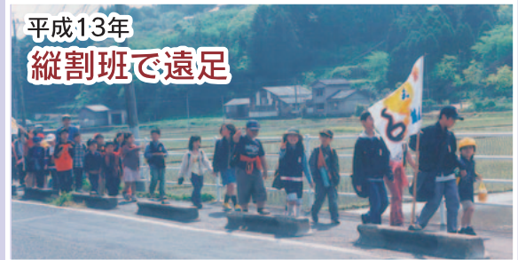
平成13年 縦割班で遠足