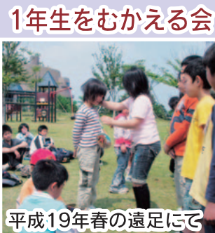
1年生をむかえる会