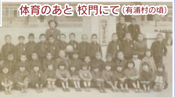
体育のあと 校門にて(有浦村の頃)