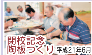
閉校記念 陶板づくり 平成21年6月