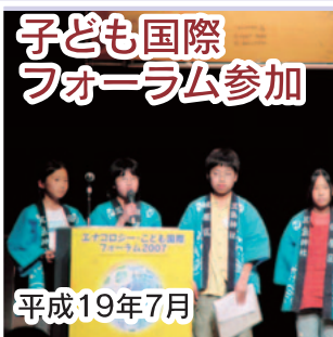
子ども国際フォーラム参加