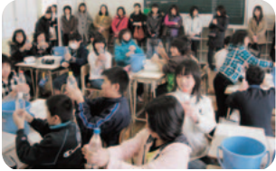
理科の実験 「なぜ浮沈子が動くのだろう」